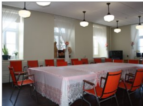
Salle de conférence